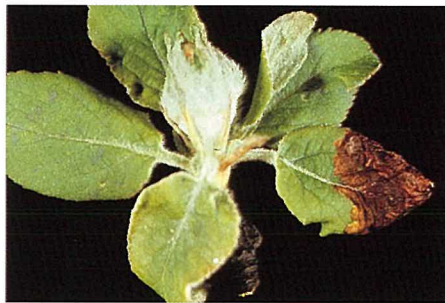
Abb. 7. Minierte Blätter verfärben sich von der Spitze aus rot, später braun und fallen ab.