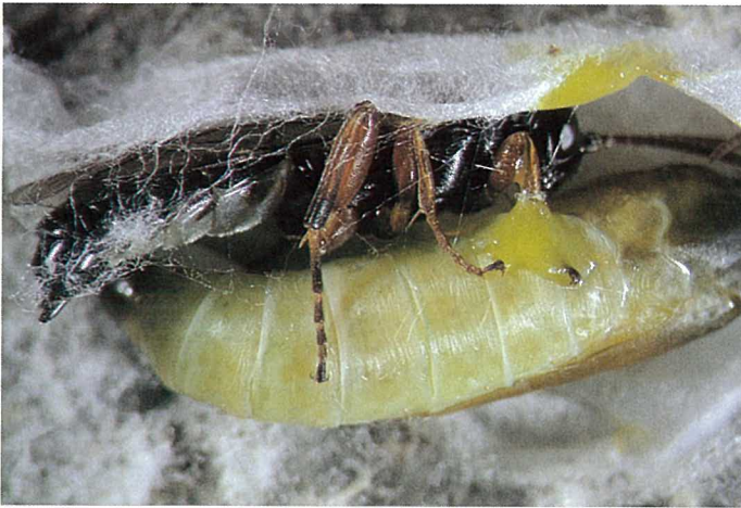
Abb. 13. Der hochspezialisierte Larven-/Puppenscharotzer Herpestomus brunnicornis , eine Schlupfwespe, muss wegen seines kurzen Legebohrers in die Gespinstmottenkokons eindringen, um seine Eier in die Mottenpuppe abzulegen.