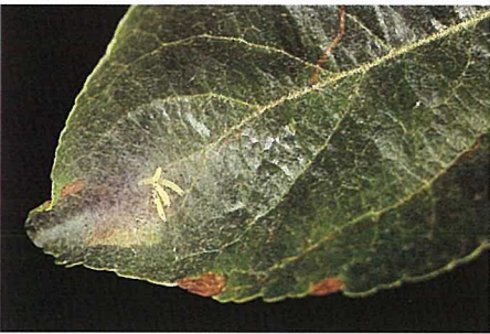
Abb. 6. Junglarven minieren junge Blätter von der Spitze zur Basis (Minierfrass) und bilden das erste kleine Gespinst.