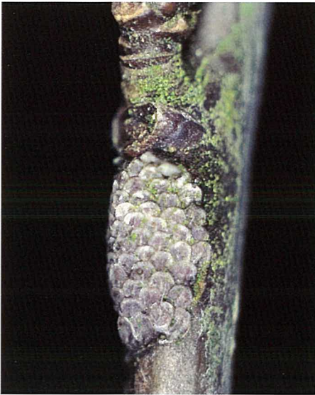
Abb. 3. In der Regel legt das Weibchen 1 Gelege mit rund 50 Eiern. Ablage an glatter Rinde junger Zweige, meist in der Nähe von Knospen.