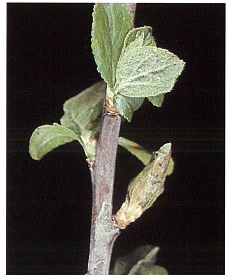
Abb. 5. Junglarven (Jungraupen) befrassen zunächst das Innere von Knospen (Knospenfrass). Diese fallen nach der Blattformung dadurch auf, dass sie tütenförmig geschlossen bleiben.