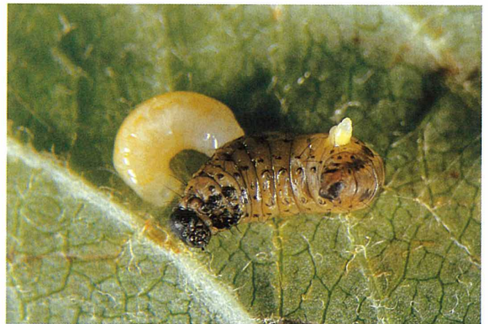
Abb. 14. Aus einer abgestorbenen Yponomeuta -Raupе schlüpft eine Diadegma armillatum -Larve. Die Gespinstmotten werden im Larven- bzw. Vorpuppenstadium von dieser Schlupfwespe parasitiert.