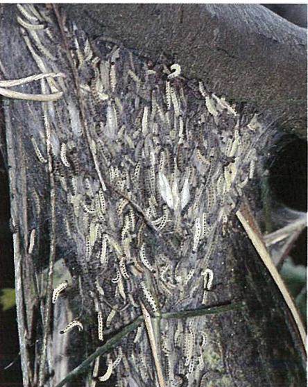
Abb. 9. Die Gespinstnester können sich zu Sammelnestern mit mehr als 1000 Raupen vereinigen. Vereinzelt verpuppen sich die Raupen bereits.