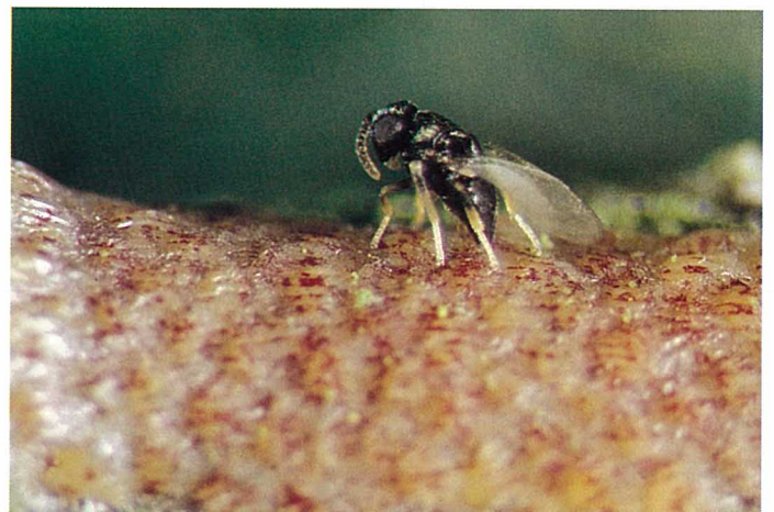
Abb. 16. Die Erzwespe Ageniaspis fuscicollis bei der Eiablage auf einem Yponomeuta -Gelege.