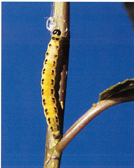
Abb. 10. Eine Raupe im 5. (letzten) Entwicklungsstadium (Grösse: ca. 20 mm lang).