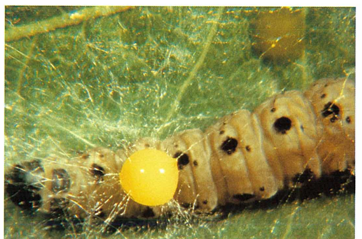
Abb. 18. Die Yponomeuta -Raupе ist mit Kernpolyederviren infiziert. Im fortgeschrittenen Krankheitsstadium treten auf der leicht reissenden Haut gelbliche, stark virenhaltige Körperflüssigkeitstropfen aus. Da sich die erkrankte Raupе noch fortbewegen kann, werden die Viren im Gespinst sowie auf Blättern und Zweigen verteilt, so dass sich die Krankheit rasch ausbreitet.