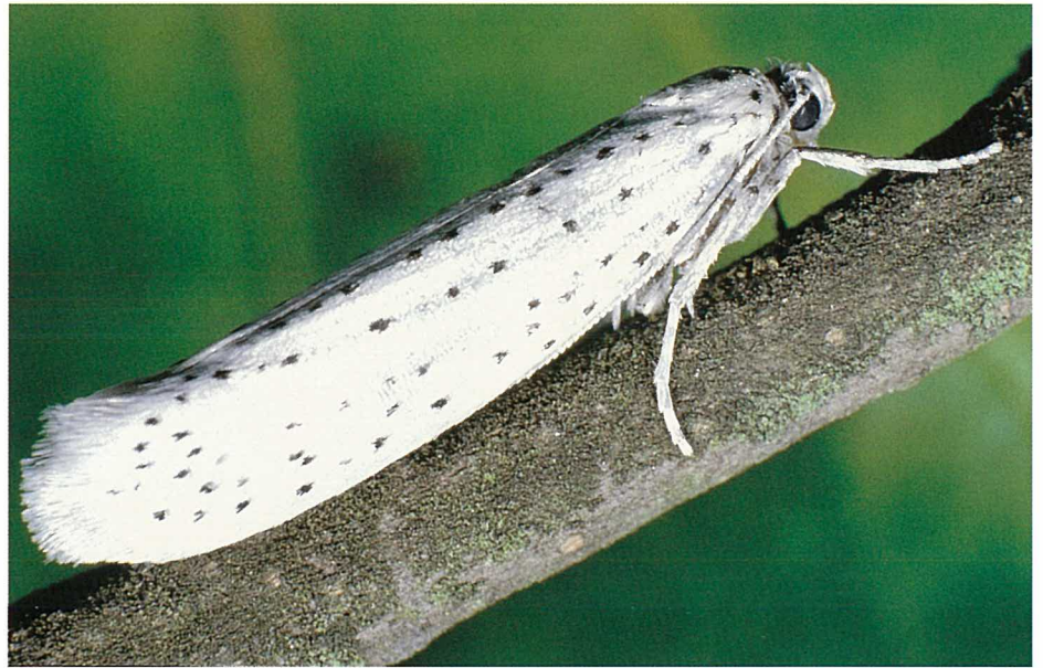
Abb. 2. Die Falter, mit einer Flügelspannweite von 15 bis 25 mm, fliegen nach Sonnenuntergang bis in die frühen Morgenstunden (Nachtfalter).

Die Raupen dieser Kleinschmetterlinge leben gesellig in grossen, weissen Gespinsten, mit denen sie die kahlgefressenen Sträucher und Bäume gänzlich überziehen, so dass man an eine Winterlandschaft erinnert ist (siehe Umschlag). Diese auffallende Erscheinung führt immer wieder zu Anfragen von interessierten oder beunruhigten Personen.