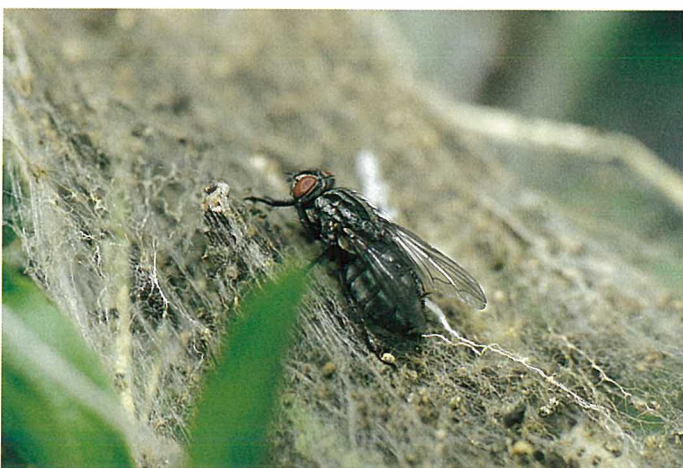
Abb. 17. Eine Larve der räuberischen Fliege Agria mamillata benötigt im Laufe ihrer Entwicklung 5 bis 8 Gespinstmottenpuppen.