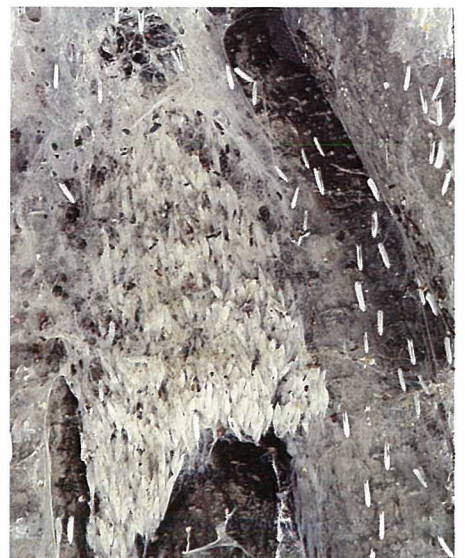
Abb. 11. Die Raupen verpuppen sich i. a. gleichzeitig im Gespinst. Es kommt jedoch auch vor, dass einige von ihnen nicht in das Puppenstadium übergehen. Diese Raupen können noch wochenlang leben und das Gespinst verfestigen und ausbessern.