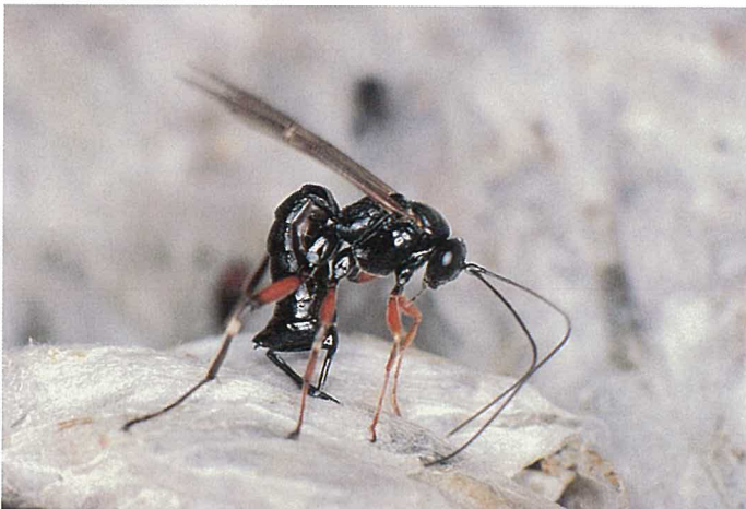
Abb. 15. Die Schlupfwespe Itopectis maculator legt ihre Eier mit Hilfe eines langen Legebohrers durch die Kokonhülle in die Gespinstmottenpuppe ab.