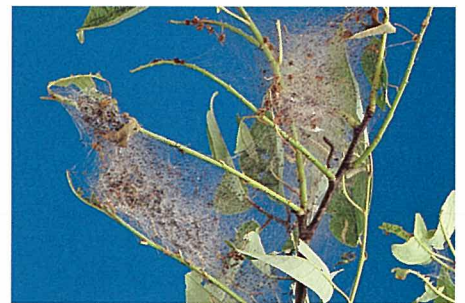
Abb. 8. Die mittlerweile etwa 5 mm langen Raupen wandern zu den Triebenden und bauen das erste grössere Gespinst, dessen Umfang sich unter Einbeziehung immer neuer Blätter und Äste vergrössert. Die Blätter werden völlig abgefressen (Kahlfrass).