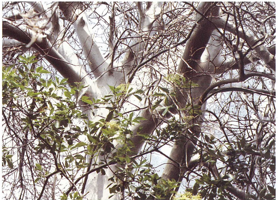
Abb. 12. Traubenkirsche ( Prunus padus ), die von Gespinstmotten kahlgefressen und eingesponnen wurde. Die zähen Gespinste lassen sich in langen Bahnen vom Baumstamm herunterziehen. Der Holunder im Vordergrund ist nicht befallen.

Die meisten Gespinstmotten haben sich im Laufe der Evolution an ganz bestimmte Nahrungspflanzen angepasst und entwickelten sich zu eigenständigen Arten. Alle Wirtspflanzen der westeuropäischen Yponomeuta -Arten gehören zu 4 Pflanzenfamilien, von denen die Rosengewächse am häufigsten vertreten sind, gefolgt von den Spindelstrauchgewächsen (Tab. 1). Sechs der neun in Europa vorkommenden Gespinstmottenarten leben nur an einer einzigen Pflanzenart. In der Schweiz tritt der auffällige Befall meist nur an der Traubenkirsche auf (Abb. 12). Meldungen, nach denen Gespinstmotten ausser auf ihren charakteristischen Wirtspflanzen gelegentlich auch auf andere Pflanzen zu Blattfrass übergehen, sind durch umfangreiche Untersuchungen widerlegt (MENKEN et al. 1992). Die Larven sind eng an ihre speziellen Wirtspflanzen gebunden. Deshalb enthält Tabelle 1 nur solche Futterpflanzen, die im Freiland mit Gespinstmotten-Eiern belegt werden. Allerdings können bei der Suche nach weiterer Nahrung auch Nicht-Wirtspflanzen von Gespinsten überzogen, aber nicht befressen werden. Selbst Zäune, Ruhebänke, Nistkästen usw. werden manchmal eingesponnen. Gespinstmotten gehen nicht an Textilien oder Haushaltsvorräte.