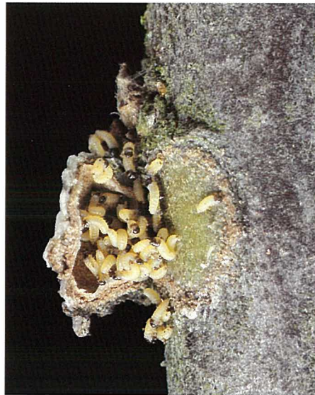
Abb. 4. Eiräupchen schlüpfen nach 3 bis 4 Wochen und überwintern unter dem zu einem Schutzschild (in der Abbildung geöffnet) umgewandelten Eigelege.